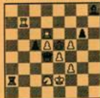
Stand na 46) ... Kf6 - e5

Waarschijnlijk beducht voor een af te intiem contact tussen beide koningen geeft Kasparov hier op. (Na z7 Td6 - e6+ - Ke5 - f4 geeft zwart mat in twee zetten. Wat een feest!) Zonder me aan te kijken geeft hij me een bliksemsnelle hand. Een ogenblik ben ik met stomheid geslagen; ik heb de legendarische Kasparov verslagen.