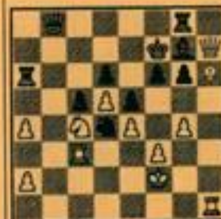
Stand na 30) ... Da7 - b8

Ik zit aan bord acht van de vierenwintig en heb dus de gelegenheid hem eens rustig te bekijken. Een keurig pak, misschien een iets te krap jasje, een schrale handdruk en een plichtmatige glimlach. Zijn gezicht is donker en het vertoont zeer wisselende stemmingen. Zijn ogen staan koud en dreigend. Op eens staat hij voor me: zijn ogen flitsen heen en weer, zijn hand schiet als een wesp over het bord. Er gaat een enorme agressie van hem uit. De verhalen waren dus niet overdreven. Een weldadig gevoel kruip in mijn borst omhoog, dit betekent strijd.